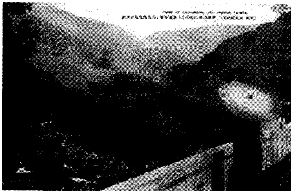
典型的な北投情緒－温泉、緑、美女

台湾の温泉資源は早くには軍事医療へ提供され、その後民間に広く利用されるようになりました。日本統治時代初期、温泉旅館や浴場の料金は高額で、一般の人々には負担できず、多くの人が危険を冒し北投溪谷の混浴露天風呂に向いました。風俗の乱れを懸念した総統府や社会団体が、積極的に社会福利性質を備えた「温泉公共浴場」を建設し、北投温泉地が発展しました。公共浴場の普及は、社会大衆の衛生を重視する概念と習慣を育て、疾病伝染の減少を目指すものでもありました。一部の頭の回転が速い商人はこの機会に乗り、温泉地区で新事業を展開しました。「温泉療養」をうたった「浴場」や「旅館」で、初めて台湾に来た日本軍を癒し、郷愁にかられる気持ちを慰めました。